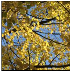
ARKIV OG BIBLIOTEK