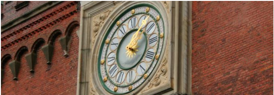
Rådhusuret den 10. oktober 2011 kl. 14.08.

Ligesom på det nuværende var der også et ur på det gamle rådhus , som man rev ned i 1880. Det var blevet sat op på rådhusgavlen ud mod Flakhaven i 1856 og havde været oplyst af