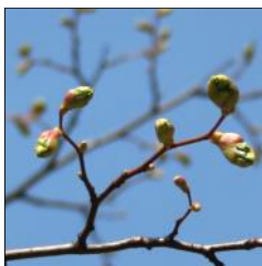
ARKIV OG BIBLIOTEK