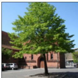
ARKIV OG BIBLIOTEK